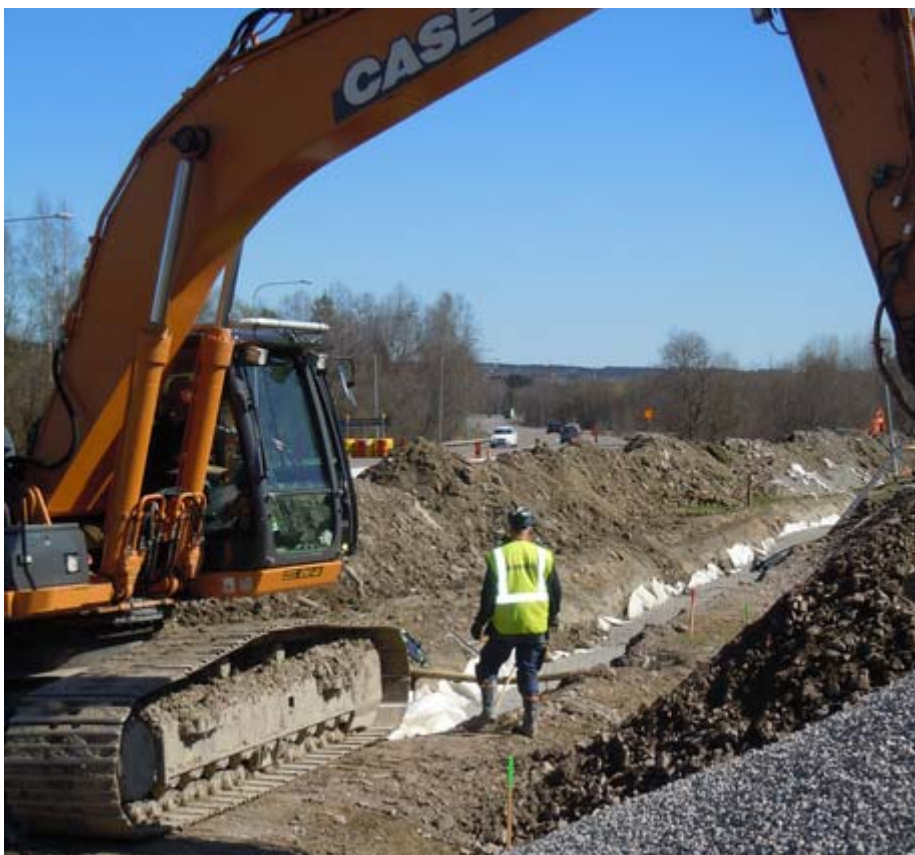
Schakt vid Ljustavägen under vecka 19.

Den nya ledningen från Östrand till Ljustadalen beräknas vara klar för att leverera värme i början på november. Projektet i sin helhet beräknas vara klart våren 2014.